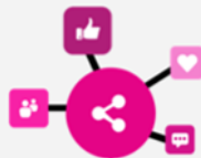
Social Sharing ソーシャルシェアリング