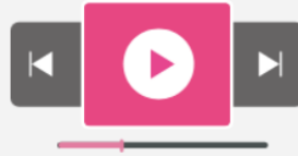
Embedded Player プレーヤーの設置